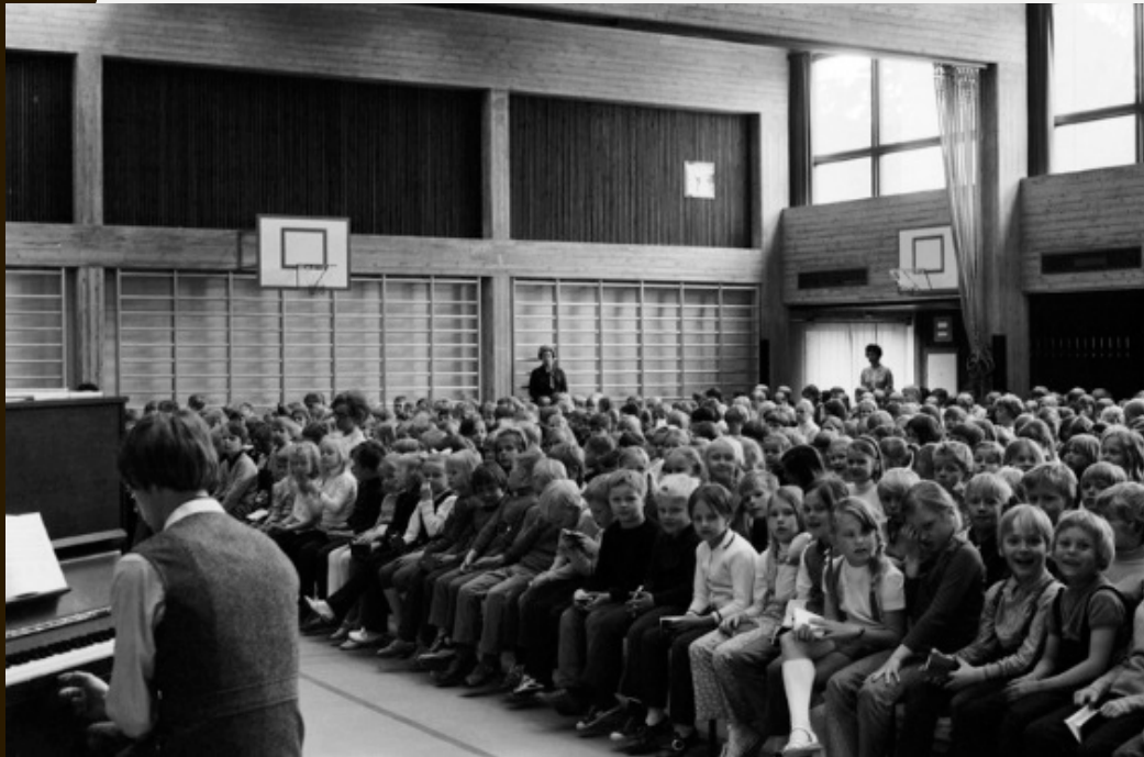
Kuva: Holmanmoisionpolku I. Yliskylän koulu 1970